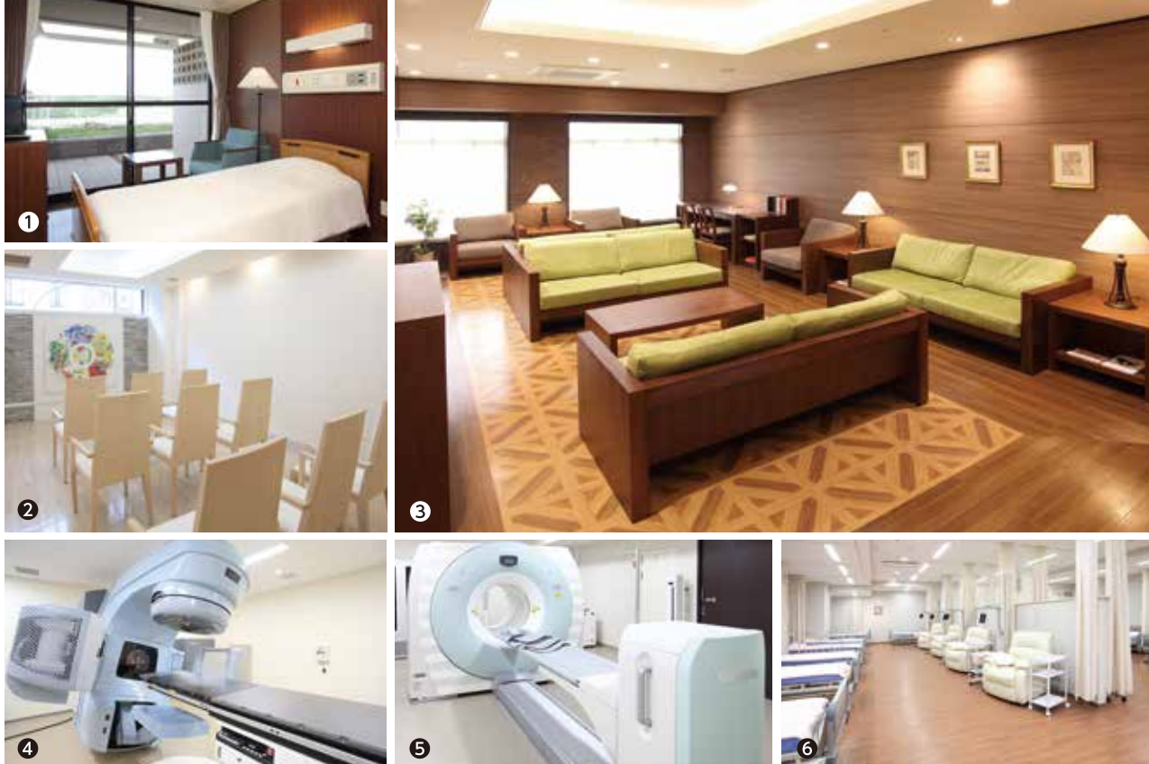
①②緩和ケア病棟 ③がん治療センターがんサロン ④リニアック ⑤PET-CT ⑥外来化学療法室